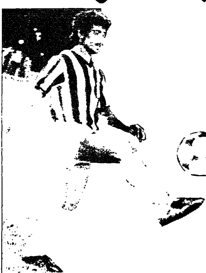
اسماعيل حكيم اول هزيمة اما الوحدة فانه يسعى اليوم ( بدون مدربه ميمي ) لتعويض خسارة امام الشباب لقاء الذي يشهده استاد مدينة الامير سعود بن جلوي بالخبر ويجمع بين النهضة والراند وهو لقاء هام بالنسبة للفريقين حيث يسعى الراند لتعويض خسارته امام الرياض ومواصلة جمع النقاط حتى ولو بالتعادل الذي يعتبر اليوم مكسبا له اذا ما علمنا ان ظروف النهضة تحتم عليه اليوم الفوز باكثر من هدف لان الهبوط اصبح يلوح امامه .. لاسيما وان في جيبه الان نقطة واحدة فيما للرائد سبع نقاط